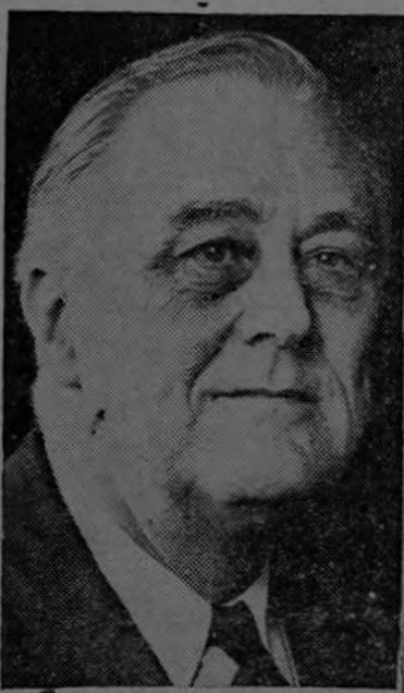
El presidente Roosevelt

Ha querido Dios premiar así al estadista eminente, al paladín de la causa libertadora de nuestros pueblos, en el álgido momento de vernos arrollados por una fuerza organizada es el acécho y en la nevosa e intacto siempre, desde que Armimo pudo sorprender a las fuerzas de Varo en una emboscada, que solo la ruindad es capaz de urdir.