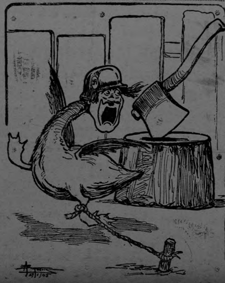
EL ULTIMO PASO DE GANSO

recientemente y que se transmitió por la radio a todas las naciones de lengua española, el Senador Chávez dijo que los hombres libres del mundo han luchado una vez más unidos ante esta grave crisis aproximando el ansiado momento en que reine una paz verdadera y perdurable.