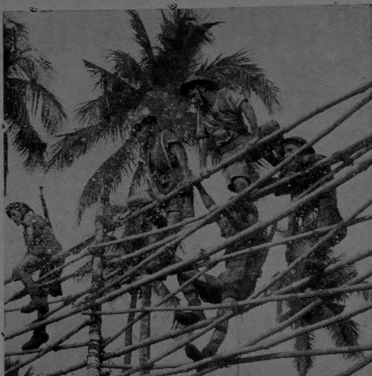
Tropas pertenecientes a las Reales Fuerzas Aéreas se mantienen en forma por medio de severos entrenamientos para la defensa de los aeródromos en las selvas de Birmania.